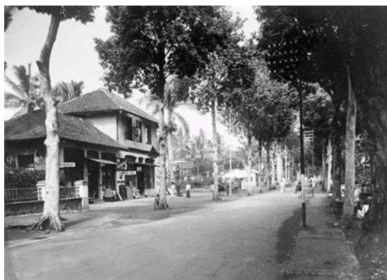
Gambar 2. Sociestraat atau Jalan Jend. Ahmad Yani pada sekarang pada tahun 1936.

Bangunan cagar budaya tidak hanya memiliki nilai fisik dan estetika, tetapi juga mengandung nilai historis dan simbolik yang merepresentasikan perjalanan sejarah serta dinamika sosial masyarakat pada suatu periode tertentu. Nilai historis bangunan tercermin dari keterkaitannya dengan peristiwa penting, fungsi awal bangunan, serta konteks waktu pembangunannya. Dalam konteks Kabupaten Garut, bangunan bersejarah menjadi saksi perkembangan pemerintahan kolonial, aktivitas sosial, serta proses modernisasi wilayah yang berlangsung sejak masa kolonial hingga awal kemerdekaan (Handinoto, 2010).