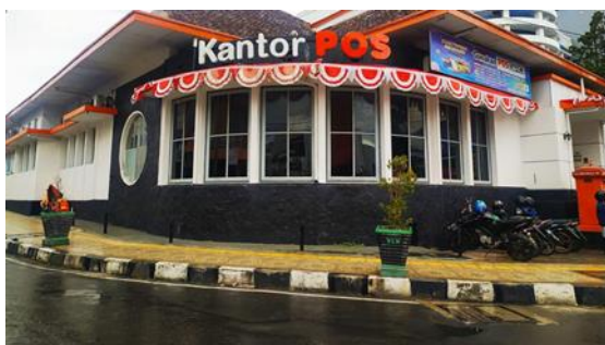
Gambar 1. Kantor Pos Garut, 2024

Kabupaten Garut dikenal sebagai salah satu kota tua di wilayah Priangan Timur yang menyimpan kekayaan arsitektur kolonial. Perkembangan kota ini berawal dari kebijakan pemerintah Hindia Belanda pada abad ke-19 yang menjadikan Garut sebagai pusat administrasi dan kota peristirahatan. Struktur tata kota yang berpusat pada alun-alun menjadi ciri khas kota kolonial di Jawa Barat, sebagaimana terlihat di Bandung dan Cianjur (Handinoto, 2010). Di sekitar alun-alun Garut berdiri bangunan penting seperti Gedung Pendopo, Kantor Pos Lama, Gereja Zebaoth, dan Hotel Papandayan, yang hingga kini masih berfungsi atau meninggalkan jejak sejarah yang kuat.