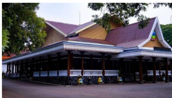
Gambar 4. Pendopo Kabupaten Garut

Dalam konteks pelestarian, analisis tipologi berperan sebagai instrumen untuk menentukan nilai penting (significance) suatu bangunan. Melalui pengelompokan tipologi, dapat diketahui elemen-elemen arsitektural yang bersifat esensial dan harus dipertahankan, seperti tata massa, fasad, proporsi ruang, serta elemen dekoratif khas. Hal ini menjadi krusial agar proses pelestarian tidak sekadar mempertahankan bentuk fisik, tetapi juga menjaga makna historis dan identitas arsitektural bangunan tersebut.