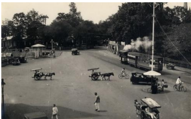
Gambar 3. Pengkolan dan Trem di Kota Garut Tahun 1930

Upaya pelestarian bangunan cagar budaya merupakan bagian penting dalam menjaga keberlanjutan nilai historis, arsitektural, dan simbolik yang terkandung di dalamnya. Di Kabupaten Garut, pelestarian bangunan cagar budaya dilakukan melalui berbagai pendekatan, antara lain penetapan status cagar budaya, pemeliharaan fisik bangunan, serta pemanfaatan adaptif yang memungkinkan bangunan tetap berfungsi dalam konteks kehidupan masyarakat modern. Pendekatan ini sejalan dengan prinsip pelestarian yang menekankan keseimbangan antara perlindungan nilai sejarah dan keberlanjutan fungsi bangunan (Feilden, 2003).