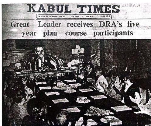
Gambar 2. Presiden Nur Mohammad Taraki

Ia kemudian menegaskan bahwa pemerintahannya saat ini sangat memerlukan dukungan rakyat. Walaupun ada sebuah media yang mengatakan bahwa Nur Mohammad Taraki sudah mendapat dukungan sejumlah lima puluh ribu orang yang jujur, berani, dan ahli dalam politik.