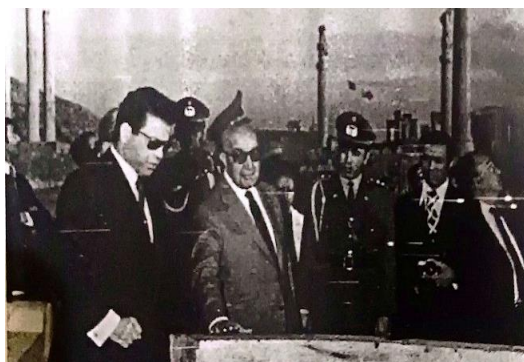
Gambar 1. Presiden Mohammad Daud Khan

Daud dikenal sebagai pemimpin yang disegani sekaligus menimbulkan kebingungan dengan sikapnya. Dalam suatu acara, misalnya, ia tampil dengan kepala plontos sambil menatap setiap orang yang melintas melalui kaca mata hitam yang dikenakannya.