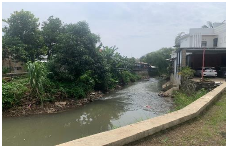
Gambar 1. Tebing sungai Bengelung Karangnanas

Lebih jauh lagi, mengingat kondisi sungai saat ini dan kondisi lingkungan di daerah hulu yang memburuk akibat penebangan liar tanpa penanaman kembali (reboisasi), ada kemungkinan hal ini dapat menimbulkan bahaya, terutama di daerah hilir. Oleh karena itu, menjaga kebersihan sungai sangat penting untuk menghindari banjir, yang dapat terjadi kapan saja.