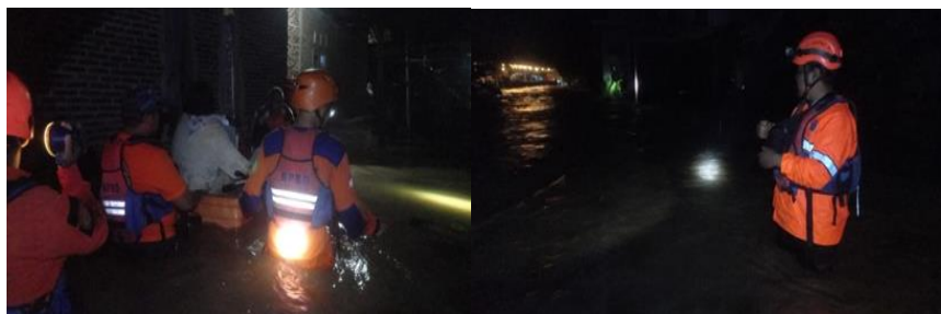
Gambar 1. Dokumentasi Evakuasi Banjir

Selain faktor alam dan kondisi sungai, masalah sampah juga menjadi salah satu penyebab banjir di desa Karangnanas. Kepala Desa Karangnanas dalam wawancaranya mengungkapkan bahwa kebiasaan membuang sampah ke sungai, terutama oleh warga dari daerah sekitar Desa Wirodadi, telah menyebabkan penyumbatan di saluran air, seperti jembatan di Sungai Bengelung. Sampah yang menumpuk tersebut menghalangi aliran air, sehingga menyebabkan genangan air yang tidak dapat mengalir dengan baik, yang akhirnya mengakibatkan banjir. Meskipun sudah ada upaya dari warga Karangnanas untuk mengingatkan ketua RT dan RW setempat dan membuat pemasangan papan peringatan larangan membuang sampah sembarangan, namun tindakan tersebut tidak efektif karena masih banyak warga yang tidak mematuhi aturan. Oleh karena itu, untuk mengurangi sampah yang menumpuk dan mencegah banjir, pemerintah desa telah berencana untuk meminta iuran sampah dari warga desa sebagai upaya untuk memperbaiki kebersihan sungai dan lingkungan sekitar. Namun hal ini masih memerlukan waktu untuk memberikan hasil yang optimal.