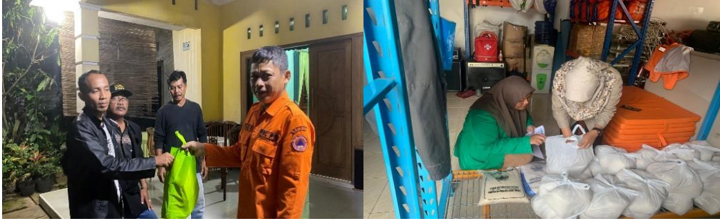
Gambar 1. di atas memperlihatkan kegiatan yang dilakukan oleh tim TRC (Tim Reaksi Cepat) Badan Penanggulangan Daerah kabupaten Banyumas Berbagi saat pendistribusian bantuan di titik lokasi terjadinya banjir. Kegiatan ini disambut dengan antusias oleh korban bencana. Gambar 2. Kegiatan pendistribusian Baantuan Sosial Korban Banjir.