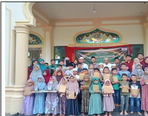
Gambar 1. Kegiatan festival anak shaleh