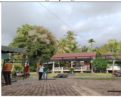
Gambar 4. Persiapan acara isra' mi'raj