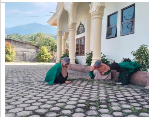
Gambar 3. Gotong royong perkarangan mesjid