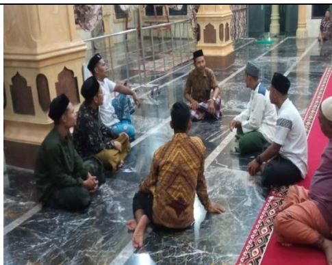
Gambar 2. Diskusi dengan aparaturng gampong