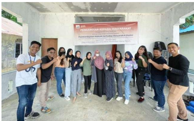
Gambar 3. Pelaksanaan Pengabdian