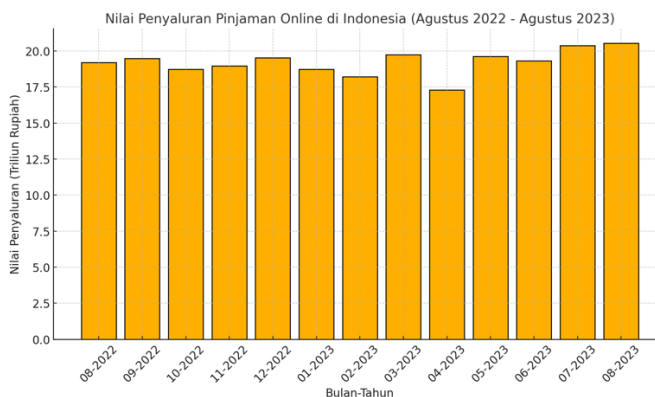
Gambar 1. Nilai Penyaluran Fintech lending di Indonesia

Perkembangan teknologi di era globalisasi telah membawa dampak signifikan pada berbagai aspek kehidupan manusia, termasuk di sektor ekonomi. Salah satu inovasi yang muncul adalah Financial Technology (Fintech), yang bertujuan untuk memberikan kemudahan dan solusi atas berbagai permasalahan ekonomi masyarakat (Sugiarto & Disemadi, 2020; Disemadi, Yusro & Balqis, 2020). Sebagai contoh, layanan pinjaman online/fintech lending menawarkan akses cepat dan syarat yang lebih fleksibel dibandingkan lembaga keuangan konvensional seperti bank (Rusadi & Benuf, 2020).