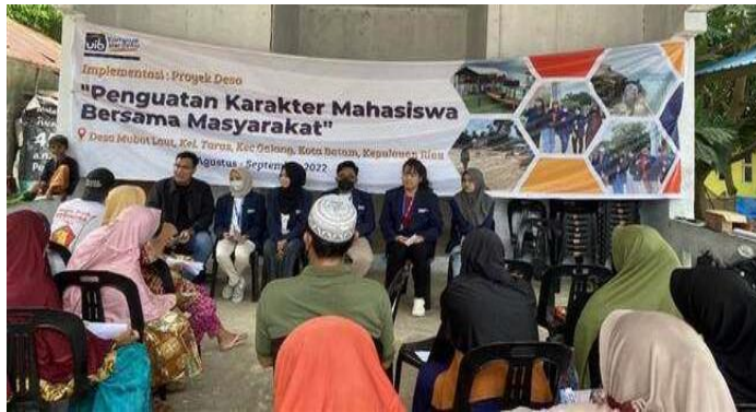
Gambar 2. Pelaksanaan Pengabdian

Dalam konteks digital, Undang-undang Nomor 1 Tahun 2024 tentang Perubahan Kedua atas Undang-Undang Nomor 11 Tahun 2008 tentang Informasi dan Transaksi Elektronik (ITE) menjadi landasan hukum terkait keamanan dan legalitas transaksi berbasis teknologi informasi. Undang-undang ini mengatur kewajiban penyelenggara teknologi informasi, termasuk fintech, untuk menjaga integritas data dan melarang praktik penyalahgunaan data pribadi. Selain itu, Pasal 28 Undang-Undang Nomor 21 Tahun 2011 tentang Otoritas Jasa Keuangan menegaskan peran OJK sebagai pengawas utama terhadap aktivitas keuangan, termasuk layanan fintech lending, untuk memastikan stabilitas dan perlindungan konsumen di sektor keuangan (Sudirman & Disemadi, 2022). Kombinasi dari berbagai regulasi ini memberikan landasan hukum yang kuat untuk mengawasi dan mengatur layanan fintech lending di Indonesia.