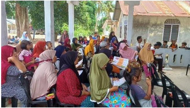
Gambar 4. Pelaksanaan Pengabdian

Dalam kasus fintech lending ilegal, pengaduan masyarakat telah mencapai 19.711 kasus menurut OJK. Platform ilegal ini kerap melanggar hukum dengan menyebarkan data pribadi peminjam sebagai ancaman. Ancaman dan kekerasan terkait pinjaman ilegal juga dapat dikenakan pasal-pasal dalam KUHP, seperti Pasal 368 tentang pemerasan dan Pasal 335 tentang perbuatan tidak menyenangkan. Penegakan hukum yang tegas diperlukan untuk memberantas praktik ini, sekaligus meningkatkan kesadaran masyarakat tentang risiko pinjaman ilegal (KOMISI XI, 2021).