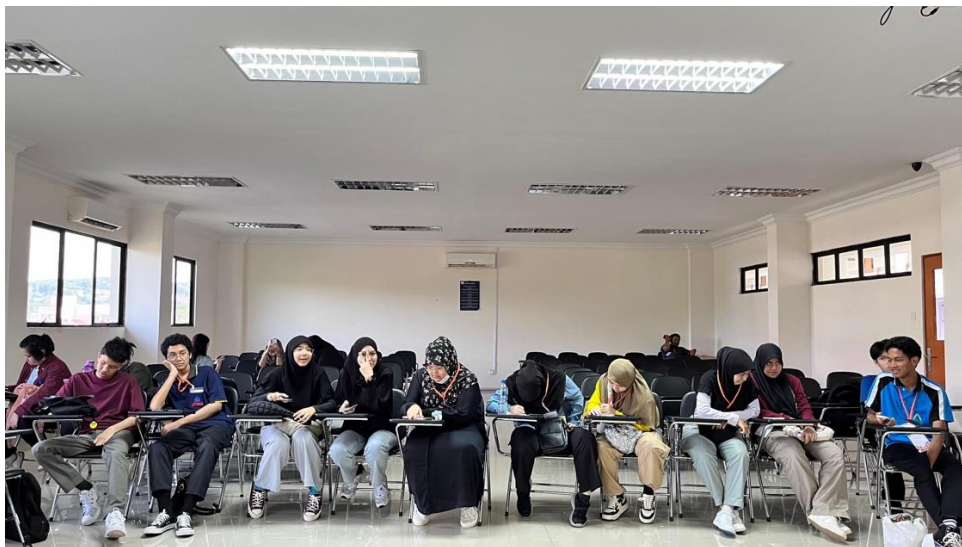
Gambar 3. Foto Peserta

kalah pentingnya, budaya dan tradisi sebagai bagian dari kekayaan intelektual komunal. Didalam materi, disertakan contoh-contoh budaya dan tradisi yang dilindungi oleh Indonesia. Persiapan materi tersebut dilakukan dengan cermat untuk memastikan bahwa peserta dapat memahami dengan baik konsep-konsep yang disampaikan. Selain itu, pemilihan contoh-contoh budaya dan tradisi yang dilindungi oleh Indonesia juga dilakukan secara teliti untuk memberikan gambaran yang jelas dan representatif kepada peserta. Materi disusun selama kurun waktu dua minggu sebelum pelaksanaan kegiatan. Materi penyuluhan hukum ini dibuat dengan pendekatan yang komprehensif dan informatif, sehingga dapat meningkatkan pemahaman peserta tentang pentingnya melindungi dan melestarikan kekayaan budaya sebagai bagian dari identitas nasional. Persiapan ini adalah upaya agar pelaksanaan penyuluhan hukum dapat berjalan lancar dan efektif. Siswa Thailand diharapkan dapat memperoleh pemahaman yang mendalam tentang kekayaan intelektual komunal serta peran hukum Indonesia dalam melindunginya.